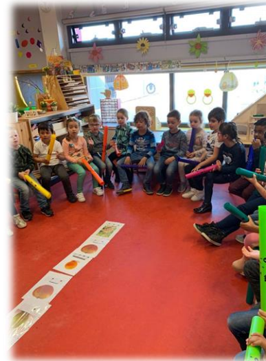
| Kleuters in de kring (Orion)

Met een aantal peuterspeelzalen in Oosterheem hebben wij peuterbezoeken gepland gericht op de peuters die 3 jaar en ouder zijn. De peuters komen in kleine groepjes onder begeleiding van een pedagogisch medewerker af en toe een ochtend meedraaien in de kleuterklas. Dit is ontstaan vanuit een wederzijdse behoefte: vaak merken ouders dat hun kind toe is aan meer uitdaging, maar het duurt nog lang voordat de basisschool begint. Of het blijkt dat de stap naar de basisschool wel erg spannend is en dan neemt de wensperiode meer tijd in beslag. Op deze manier versterken wij de samenwerking tussen peuterspeelzalen en basisschool waar de peuters direct van profiteren.