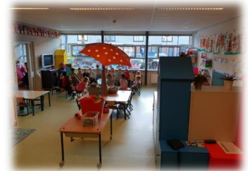
| Kleuterruimte (Cygnus)