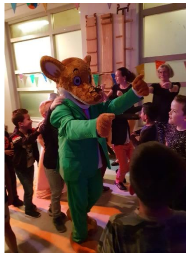
Boekenbal georganiseerd door OR