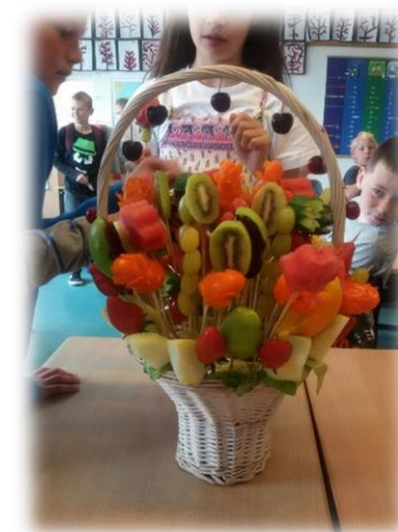
Gezonde traktatie: fruitmand

Alternatieven, maar zeker ook lekker en gezond: geef een tussendoortje met minder vet en suiker, zoals een rijstwafel, minikrentenbol, plakje ontbijtkoek of kinderkoekje. Let u bij de kinderkoekjes ook op de hoeveelheid; geef bijvoorbeeld niet de hele verpakking mee. Vaak zijn deze koeken per 2 of 3 verpakt, maar dat is zeker voor jonge kinderen te veel als tussendoortje. Valkuilen zijn ook de kinderdrinkpakjes die boordevol suikers zitten. Kinderen hebben voldoende vocht nodig, maar zoek naar goede alternatieven zoals magere of halfvolle (school)melk, karnemelk, yoghurt drank (light) of water. ( www.gezondheidsnet.nl )