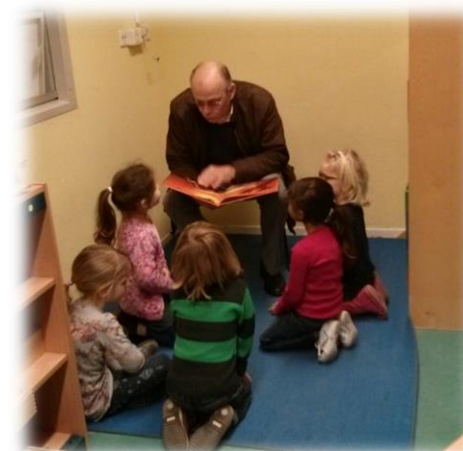
| Voorleesochtend door opa's