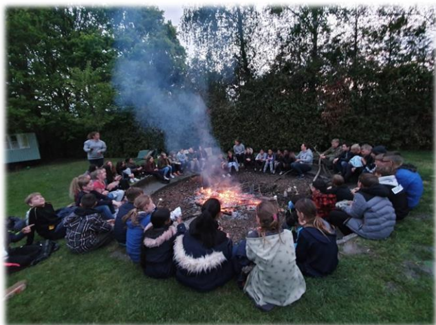
| Groep 8 gezellig rond het kampvuur

Ook ontvangt u een lijst waarop u kunt aangeven waar de leiding rekening mee moet houden, zoals bijvoorbeeld dieet of medicijngebruik. De ervaring leert dat iedereen fantastische dagen heeft en moe maar zeer voldaan thuis komt! De kosten voor het kamp bedragen rond de 110 euro per leerling.