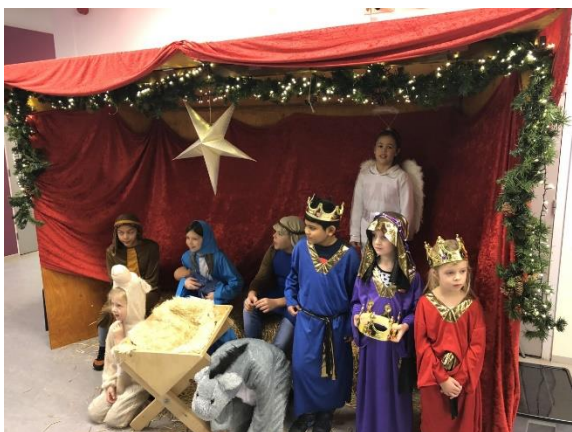
Levende Kerststal mogelijk gemaakt door OR