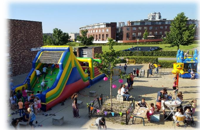
| Zomerfeest op beide locaties