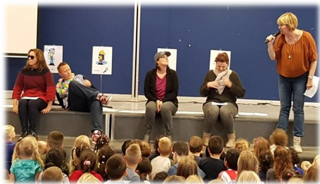
Team speelt Bikkelypetjes na tijdens de Bikkelweek

'Bikkels' is de lesmethode die wij gebruiken bij het leren respectvol met elkaar om te gaan. De methode geeft een positieve insteek in het (zelf)reguleren van gedrag. Ook is er in de methode Bikkels aandacht voor leren reflecteren, groepsvorming, stress meten en relativeren, de overgang naar middelbaar onderwijs en leren plannen.