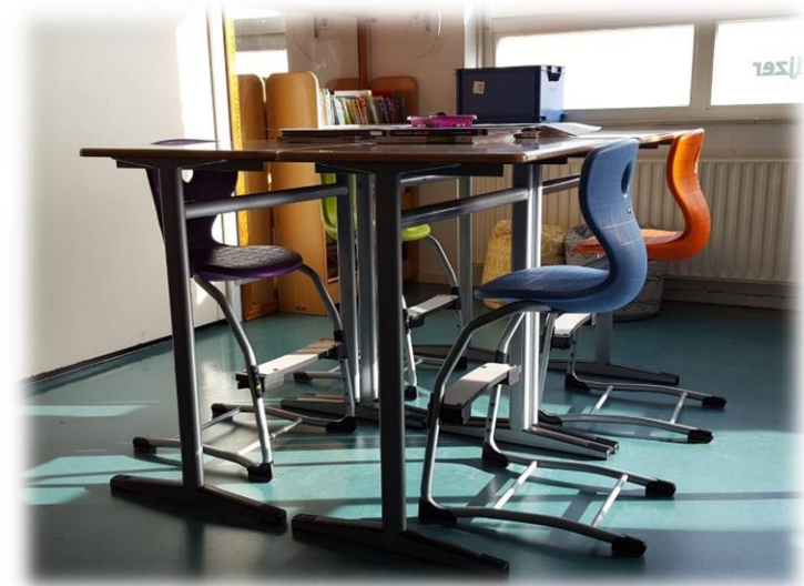
Nieuwe meubilair; tafels op gelijke hoogte, stoelen met verstelbare voetenplank, kunststof zitting in vrolijke kleuren

Maar ook van en met elkaar kunnen wij als team leren. Binnen ons grote en uiterst professionele team is veel kennis aanwezig. Het vergroten, delen en borgen van deze kennis is dan ook het doel van de professionele leergemeenschap (PLG) die wij starten. Het bestaat uit diverse stuurgroepen (taal/lezen, rekenen, ICT, HB, jonge kind, gezonde school, SEO) die elk op hun eigen gebied verantwoordelijk zijn voor het vergroten, delen en borgen van kennis. Dit kan plaatsvinden tijdens speciale stuurgroep-vergaderingen. Maar ook tijdens de verschillende studiedagen verspreid over het gehele schooljaar. Deze studiedagen zijn opgenomen in de kalender. U bent dan ruimschoots op tijd op de hoogte van de vrije dagen van uw kind.